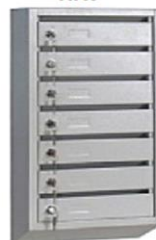
Почтовые ящики Серия КП